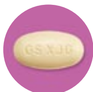
タイケルブ錠 (実物大)

1日1回5錠、食事の前後1時間以内を避けて服用してください。 ご自分で都合のよい服用時間を決めて、毎日その時間に飲むように しましょう。